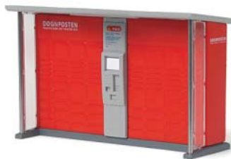
Paketautomat Typ FS „Døgnposten Post Danmark“ 70227 | 1:87 | BV | DK | PG 14