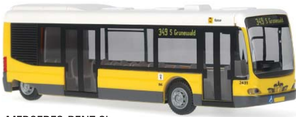
MERCEDES-BENZ Cito „BVG, Berlin Standarddesign“ 63340 | 1:87 | BV | D | PG 32