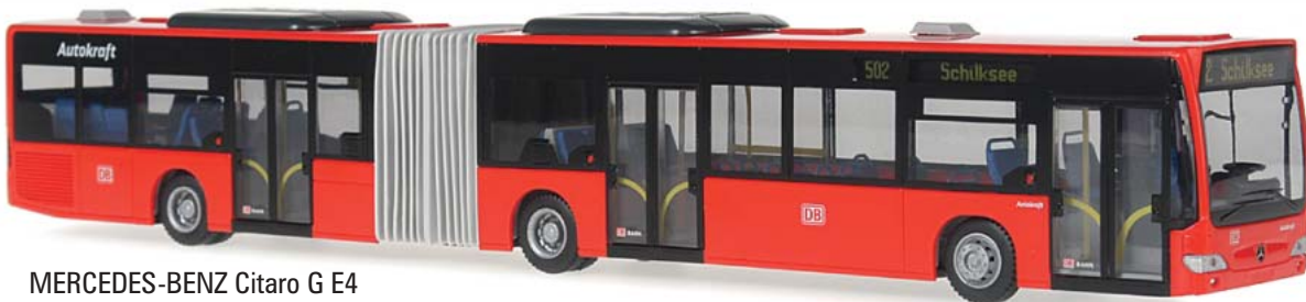
MERCEDES-BENZ Citaro G E4 „Autokraft DB Design“ 66643 | 1:87 | BV | D | PG 47