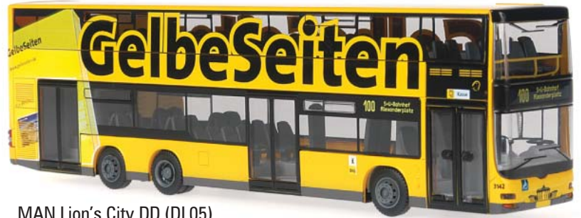
MAN Lion's City DD (DL05) „BVG, Berlin - Gelbe Seiten“ 67326 | 1:87 | BV | D | PG 49