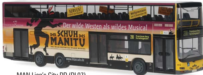
MAN Lion's City DD (DL07) „BVG, Berlin - Der Schuh des Manitu“ 67712 | 1:87 | BV | D | PG 49