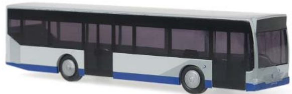
MERCEDES-BENZ Citaro „Havelbus Verkehrsgesellschaft, Potsdam“ 16145 | 1:160 | BV | D | PG 21

Rietze Automodelle GmbH & Co. KG In der Herrnau 1 • 90518 Altdorf Tel.: 09187/9600 • Fax: 09187/96030 eMail: info@rietze.de • www.rietze.de