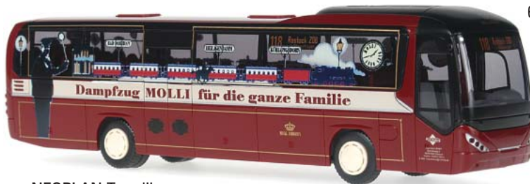
NEOPLAN Trendliner „Küstenbus, Bad Doberan“ 65608 | 1:87 | BV | D | PG 40