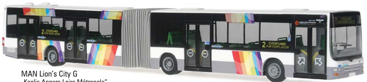
MAN Lion's City G „Keolis Angers Loire Métropole“ 67225 | 1:87 | BV | F | PG 47