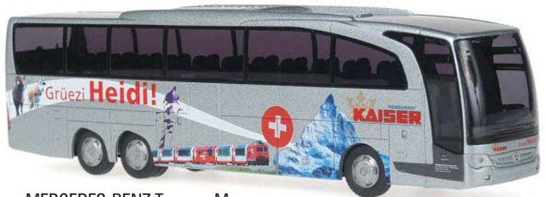
MERCEDES-BENZ Travego M „Reisedienst Kaiser, Zwickau“ 66325 | 1:87 | BV | D | PG 42