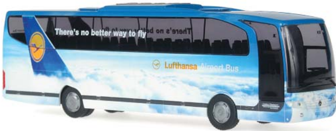
MERCEDES-BENZ Travego „Lufthansa Airport Bus“ 63865 | 1:87 | BV | D | PG 40