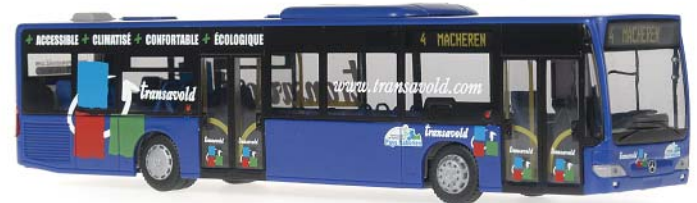
MERCEDES-BENZ Citaro E4 „Transavold“ Transavold ist ein überregionales Verkehrsunternehmen und bietet in der Region Lothringen und Champagne einigen Gemeinden ÖPNV Leistungen an. Dazu gehört Saint-Avold an der Grenze zum Saarland. Der Citaro fährt auf der Linie 4 von St. Avold nach Macheren. Transavold gehört zu Veolia Transport.

66546 | 1:87 | BV | F SONDERMODELL PG 39