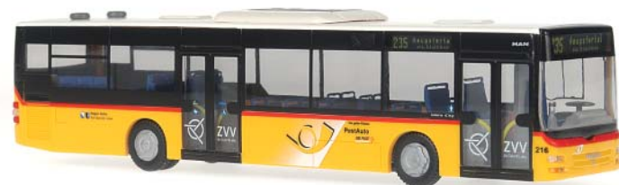
MAN Lion's City 2-türig „Die Post“ Ein Lion's City der Postbus Region Zürich. Das Fahrzeug gehört der Rolf Stutz AG in Jonen und ist unterwegs auch im Dienste der ZVV Zürich. Zielangabe: Linie 235, Aeggstertal.

66546 | 1:87 | BV | F SONDERMODELL PG 39