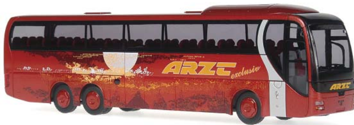
MAN Lion's Coach L „Arzt Reisen, Seligenporten“ Einer der ersten Coach L Modelle, die als Formneuheit erscheinen, in aufwändigem MAN Vorführdesign und rotmetallic Grundlackierung. Der Fuhrpark des Reiseunternehmens Arzt umfasst 56 Busse, ein großer Teil davon sind Stadtbusse, die für die VAG Nürnberg, die infra Fürth und das DB Busunternehmen OVF aus Nürnberg fahren.