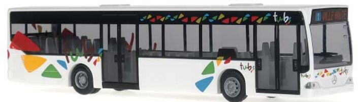
MERCEDES-BENZ Citaro „Tub, Bar le Doc“ Tub im Städtchen Bar le Doc, in der Region Lothringen ist ein Tochterunternehmen der Veolia Transport, die international auftritt und als Partner von Kommunen im Personennahverkehr mit Bahn- und Busnetzen Leistungen anbietet. In Bar le Doc werden von Tub vier Linien unterhalten, unser Modell fährt auf der Linie 1 von Sainte-Catherine nach Ville Haute.

66946 | 1:87 | BV | F SONDERMODELL PG 37