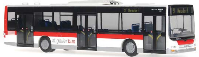
MAN Lion's City 3-türig „VBSG Verkehrsbetriebe St. Gallen“ In der schweizer Stadt St. Gallen, die zugleich die Hauptstadt des Kantons ist, wurden für die VBSG im vergangenen Jahr eine Reihe neuer MAN Busse bestellt. Die neuen 3-türigen Diesel Lion's City wurden bis in das Jahr 2008 ausgeliefert und in Dienst gestellt, sie werden „St.GallerBus“ genannt. Zielangabe: Linie 2, St. Georgen-Bach