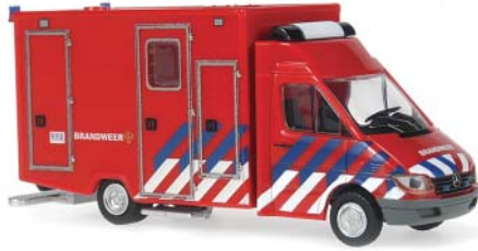
WIETMARSCHER MB Sprinter RTW „Brandweer“ Ein MB Sprinter mit Wietmarscher Kofferaufbau, passend zu unserer niederländischen Brandweer Serie.