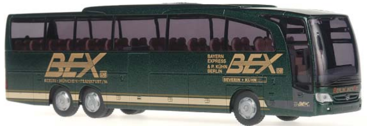
MERCEDES-BENZ Travego M „BEX, Berlin“ Unsere umfangreiche Fahrzeugflotte der BEX GmbH aus Berlin erweitern wir hiermit um einen Travego M. Das seit 1945 bestehende Unternehmen verbindet den nationalen und internationalen Fernbuslinienverkehr von Berlin mit mehr als 350 Zielorten in Deutschland und Europa.

66324 | 1:87 | BV | D WERKSEITIG AUSVERKAUFT PG 39