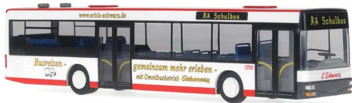
MAN NL „Omnibusbetrieb E. Schwarz, Sarzbüttel“ Das Familienunternehmen Erich Schwarz in Sarzbüttel an der Nordseeküste bietet Linien- und Behinderten-beförderung im Auftrag der Autokraft. Weitere Angebote sind Reiseverkehr für Gruppen und Vereine. Der Fuhrpark umfasst 38 Fahrzeuge vom Kleinbus bis hin zu Linien- und Reisebussen.

66324 | 1:87 | BV | D WERKSEITIG AUSVERKAUFT PG 39