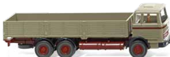
0433 03 Hochbordpritschen-Lkw (MB) UVP 13,99 €

In 1:87 gibt es ein Wiedersehen mit wunderschönen Klassikern wie dem legendären Mercedes-Benz C 111, aber auch dem Mercedes-Benz L 3500 als Service-Kranwagen. In den einstigen Farben des Henschel-Kundendienstes erscheint der VW T1. Der Mercedes-Benz mit kubischem Fahrerhaus und Hochbordpritsche ergänzt die zeitgenössischen WIKING-Miniaturen genauso wie der Ford