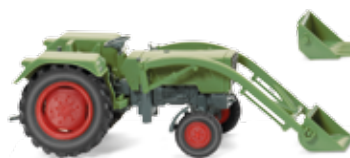
0890 03 Fendt Farmer 2S mit Frontlader UVP 12,49 €