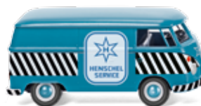
0797 16 VW T1 Kastenwagen UVP 14,49 €