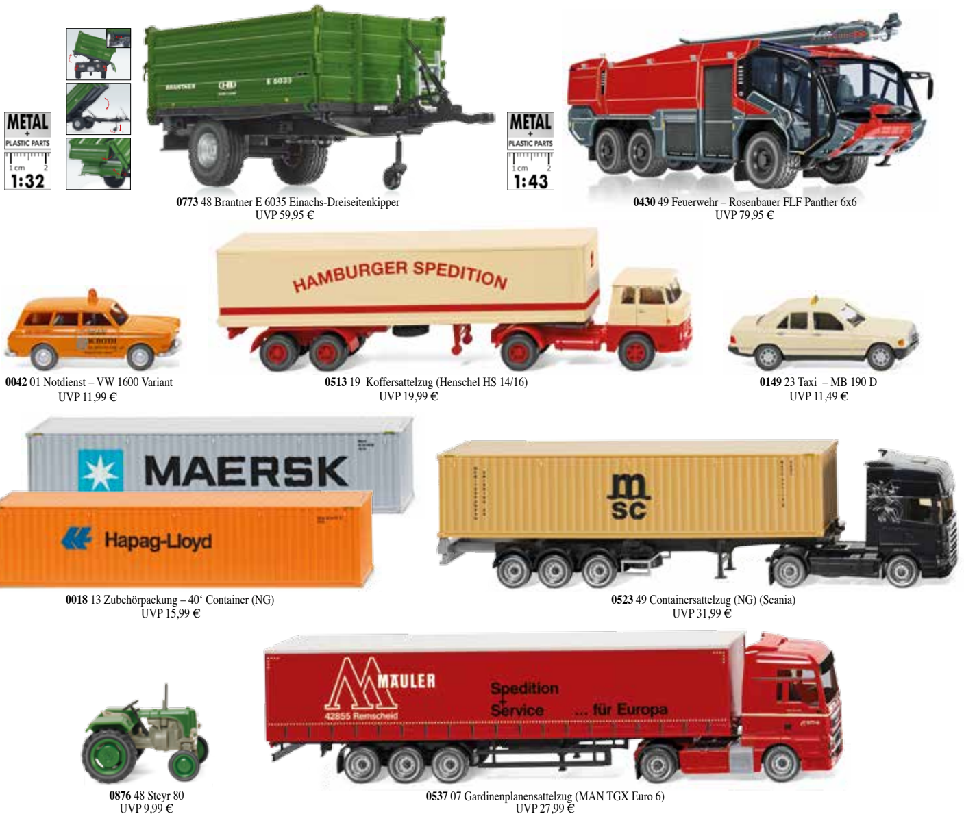
0773 48 Brantner E 6035 Einachs-Dreiseitenkipper UVP 59,95 €