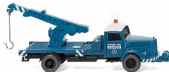
0421 01 Autokran (MB L 3500) UVP 13,49 €