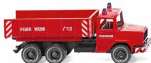
0624 02 Feuerwehr - Schuttwagen (Magirus Deutz) UVP 13,49 €