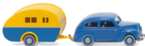
0820 04 Ford Taunus G73A mit Reiseanhänger UVP 18,49 €