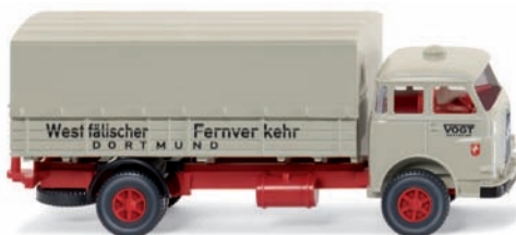
0416 01 Pritschen- Lkw (MAN Pausbacke) UVP 14,49 €