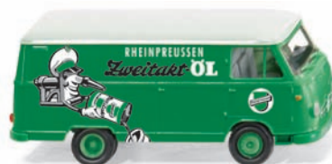
0270 47 Borgward Kastenwagen B611 UVP 12,49 €