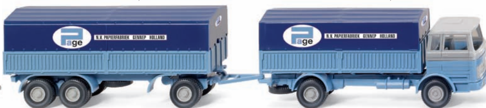
0410 01 Stahlpritschenhängerzug (MB LP 1620) UVP 19,99 €