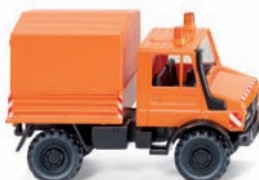
0374 02 Unimog U 1700 - Kommunaldienst UVP 11,49 €