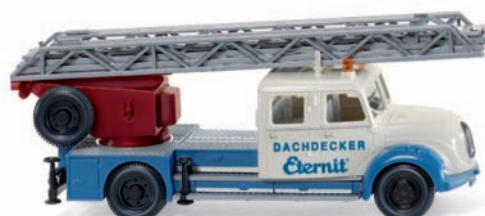
0862 35 Hebebühnenwagen (Magirus) UVP 20,99 €