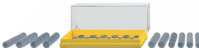
0018 06 Zubehörpackung - Räder UVP 11,49 €