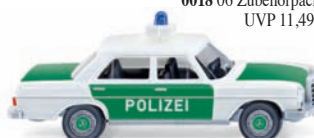
0864 24 Polizei - MB 200/8 UVP 12,99 €