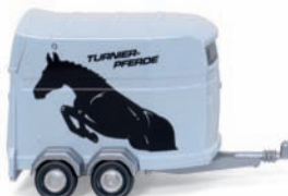
0066 04 Pferdeanhänger UVP 7,99 €