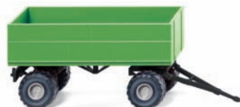
0388 39 Landwirtschaftlicher Anhänger UVP 5,99 €