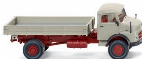
0895 04 Pritschenkipper (MB LAK 710) UVP 13,99 €