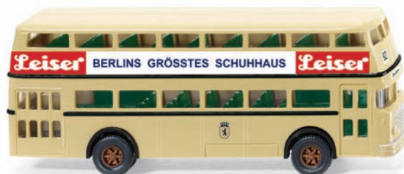
0722 03 Doppeldeckerbus D2U (Büssing) UVP 17,99 €

Youngtimer und bewährte Klassiker führt WIKING gelungen zusammen: Besonders die legendäre Parkhalle dürfen die Markenenthusiasten einmal mehr in ihre Sammlung historischer WIKING-Modelle einreihen. Nur wenige Jahre war einst das Fertigmodell aus dem Zubehörprogramm der Traditionsmodellbauer erhältlich, ehe seine Formen für Jahrzehnte im Archiv verschwanden. Unterdessen gibt sich der BMW