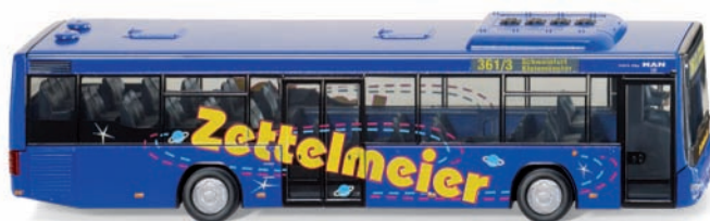
0707 02 MAN Lion's City A78 UVP 23,99 €