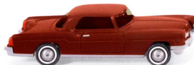
0210 01 Ford Lincoln Continental UVP 11,49€