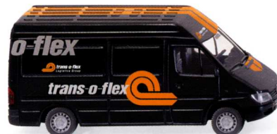
0285 49 MB Sprinter - Kastenwagen UVP 11,49€