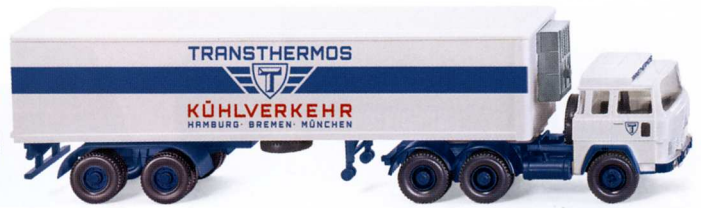
0528 49 Kühlkoffersattelzug (Magirus 235 D) UVP 19,99€

Beides sind Klassiker, die untrennbar mit der deutschen Nachkriegsgeschichte verbunden sind: WIKING stellt mit der August-Auslieferung das Glas Goggomobil mit filigranem Faltdach und den Ford FK 1000 als Kastenwagen vor. Beide Neuheiten erscheinen dank typischer WIKING-Handschrift filigran detailliert und komfortbedruckt. Darüber hinaus bringen der Ford Granada als Polizeifahrzeug und der Magirus 235 D