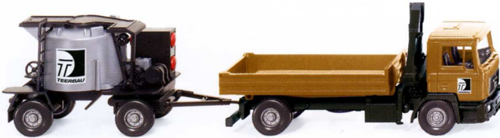
0689 03 Gussasphaltkocher-Hängerzug (MAN F 90) UVP 17,49€