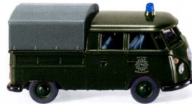
0864 19 Polizei - VW T1 Doppelkabine mit Plane UVP 12,99€