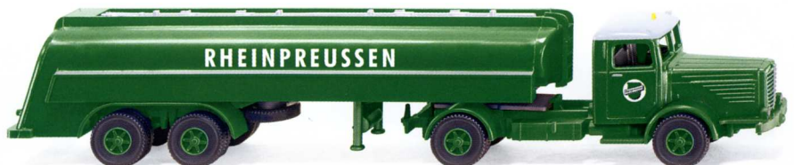
0882 49 Tanksattelzug (Büssing 8000) UVP 18,99€

Vier Jahrzehnte Automobilgeschichte – WIKING führt die Epochen in der Modellpflege facetten- und spannend zusammen. Mit der legendären Brennstoffmarke „Rheinpreussen“ fährt der Tanksattelzug Büssing 8000 ins Programm, während der Ford Lincoln Continental und die MB Pagode als gestandene Chromklassiker die 1960er-Jahre Re-