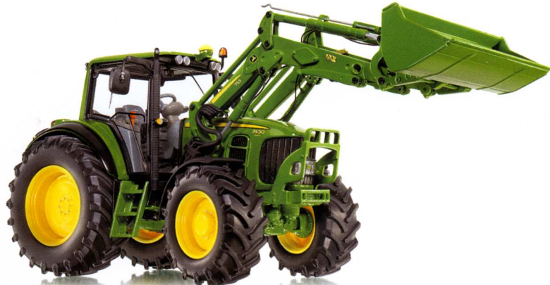
0773 09 John Deere 7430 mit Frontlader UVP 59,95 €