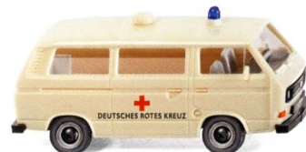
0320 02 DRK - VW T3 Bus UVP 11,49€