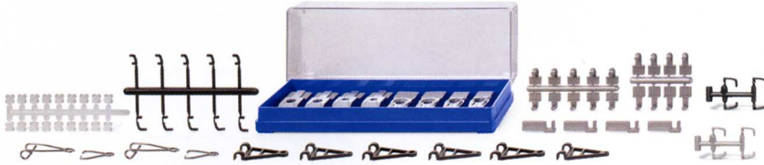
0018 05 Zubehörpackung - Verbindungen UVP 9,99€