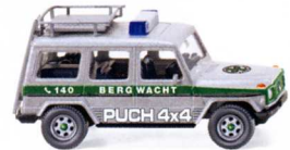
0278 03 Puch G UVP 14,99€