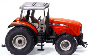
0385 05 Massey Ferguson MF 8270 UVP 12,49€