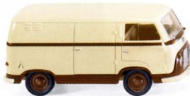
0289 01 Ford FK 1000 Kastenwagen UVP 11,99€