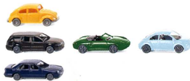
0918 08 Set mit 3 verschiedenen Pkw (Mix) N-Spur 1:160 UVP 7,99€