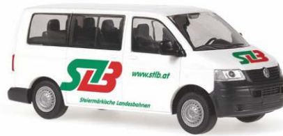
VOLKSWAGEN T5 Transporter Bus „STLB, Graz“ 31199 | 1:87 | BV | A | PG 23**