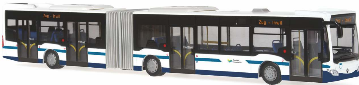
MERCEDES-BENZ Citaro G Mod. 2012 „Zugerland Verkehrsbetriebe, Zug“ 69501 | 1:87 | FN | CH | PG 49*