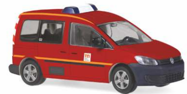
VOLKSWAGEN Caddy Mod. 2011 Bus „Feuerwehr Messe Düsseldorf“ 52906 | 1:87 | BV | D | PG 23**