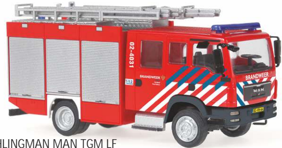
SCHLINGMAN MAN TGM LF „Brandweier“ 68225 | 1:87 | BV | NL | PG 40