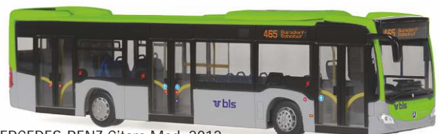
MERCEDES-BENZ Citaro Mod. 2012 „BLS, Bern“ 69404 | 1:87 | BV | CH | PG 47*