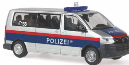
VOLKSWAGEN T5 Transporter GP Bus „Polizei Österreich“ 52667 | 1:87 | BV | A | PG 23**