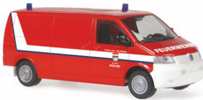
VOLKSWAGEN T5 Transporter Bus VF „Feuerwehr Mödling“ 51864 | 1:87 | BV | A | PG 23**