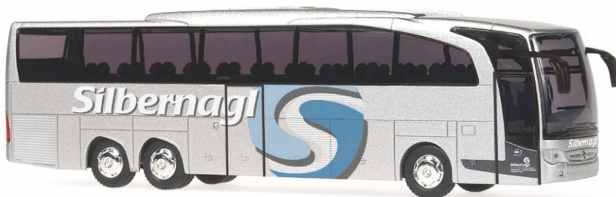
MERCEDES-BENZ Travego M Euro 6 „Silbernagl, Kastelruth“ 69701 | 1:87 | FN | I | PG 47*