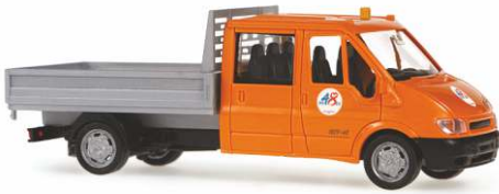
FORD Transit Mod. 2000 DoKa Pritsche „Stadtreinigung Wien“ 31134 | 1:87 | BV | A | PG 22