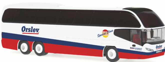
NEOPLAN Cityliner C Mod. 2007 „Orslev, Vordingborg“ 63973 | 1:87 | BV | DK | PG 45