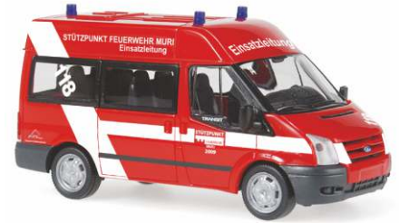
FORD Transit Mod. 2006 Bus „Feuerwehr Muri“ 50731 | 1:87 | BV | CH | PG 22