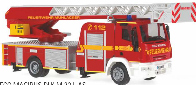
IVECO MAGIRUS DLK M 32 L-AS „Feuerwehr Mühlacker“ 68533 | 1:87 | BV | LIMIT500 | BOX | PG 45