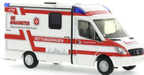
STROBEL MB Sprinter RTW „Die Johanniter Rheinessen“ 61699 | 1:87 | BV | D | PG 28*