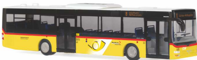
MAN Lion's City „Die Post - PostAuto“ 67465 | 1:87 | BV | CH | PG 45