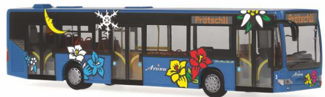
MERCEDES-BENZ Citaro E4 „Arosa Bus“ 65119 | 1:87 | BV | CH | PG 47*